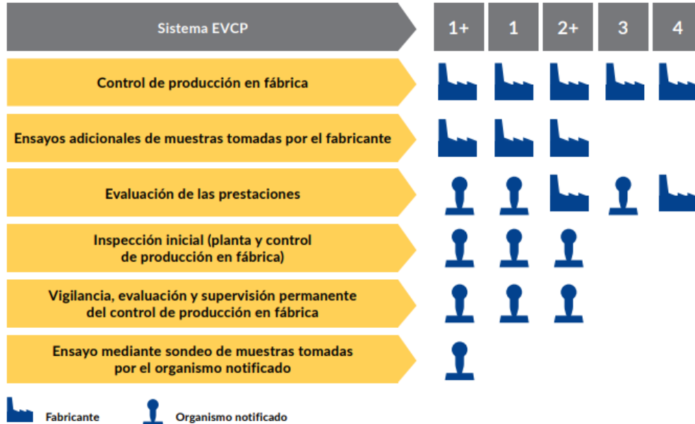
Imagen: esquema del funcionamiento de los diferentes sistemas EVCP existentes en el RPC. Obtenido del documento "MERCADO CE DE LOS PRODUCTOS DE CONSTRUCCIÓN PASO A PASO".

En este caso, en función del uso previsto del producto (ver Anexo ZA de la norma armonizada), el fabricante deberá usar el sistema 1 o el sistema 3 (o el sistema 4 de manera excepcional, según artículo 37 RPC):