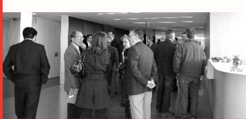
El sector se volcó con la I Jornada de Puertas Abiertas.