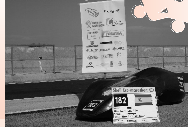
Circuito francés de Nogaro

en el número de proyectos de I+D+i puestos en marcha por la Federación en último año y como "preludio de la futura entidad de apoyo de la innovación ubicada en el Centro para el Fomento del Empleo y Desarrollo Tecnológico del Sector Metal". Precisamente, el Plisplayet formará parte de la inauguración del futuro Centro de Excelencia del Metal prevista para el primer trimestre de 2009.