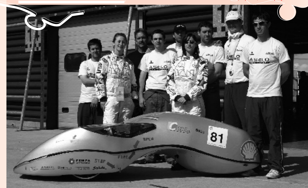
Equipo de ingenieros de la Politécnica de Alcoy, ante su proyecto, el Plisplayet.