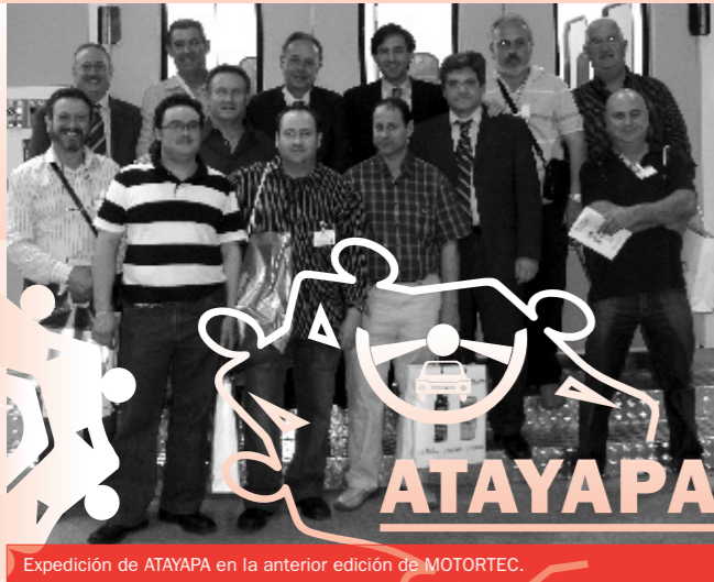
Expedición de ATAYAPA en la anterior edición de MOTORTEC.

IFEMA acoge bianualmente Motortec, que en esta edición 2009 se desarrolla desde el 10 al 14 de marzo. El Salón Internacional de Equipos y Componentes para la Automoción es una cita ineludible. Desde hace 18 años, se celebra este encuentro que va por su décima edición.