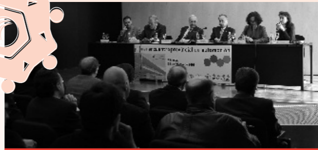
CETRAA presentó el Decálogo en el nuevo Centro del Metal.