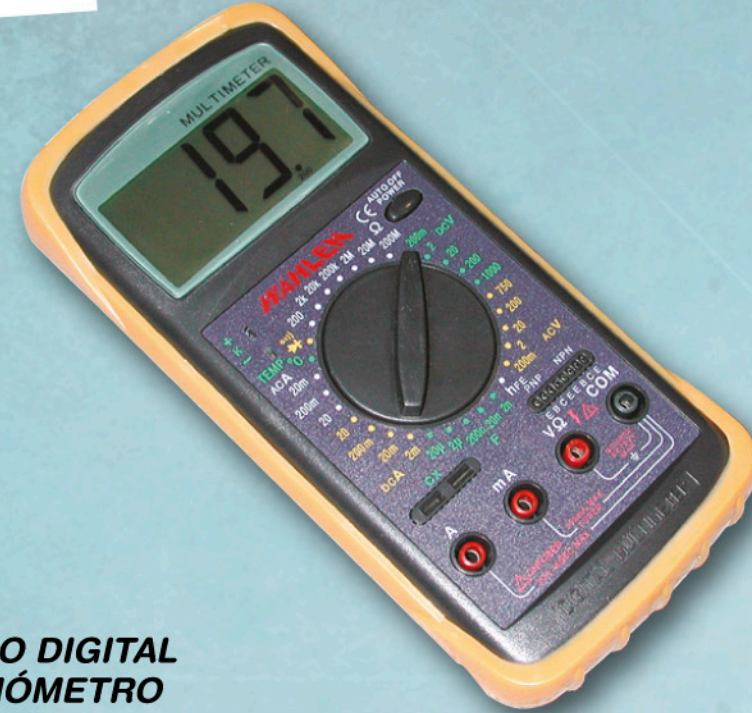
01265 POLÍMETRO DIGITAL CON TERMÓMETRO