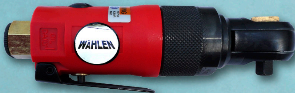
6073240 CARRACA NEUMÁTICA (MINI)