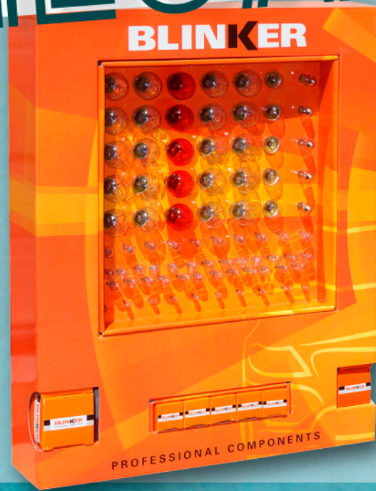
002912 EXPOSITOR LÁMPARAS BLINKER 100