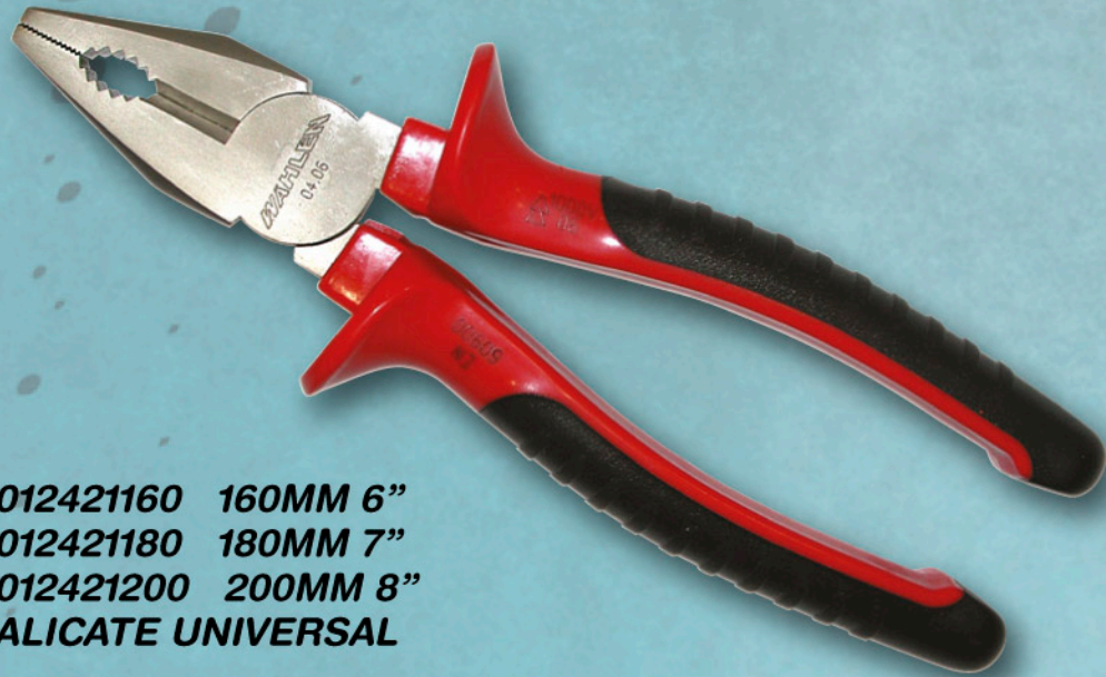
012421160 160MM 6" 012421180 180MM 7" 012421200 200MM 8" ALICATE UNIVERSAL