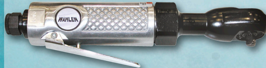
6073000 CARRACA NEUMÁTICA 1/4"