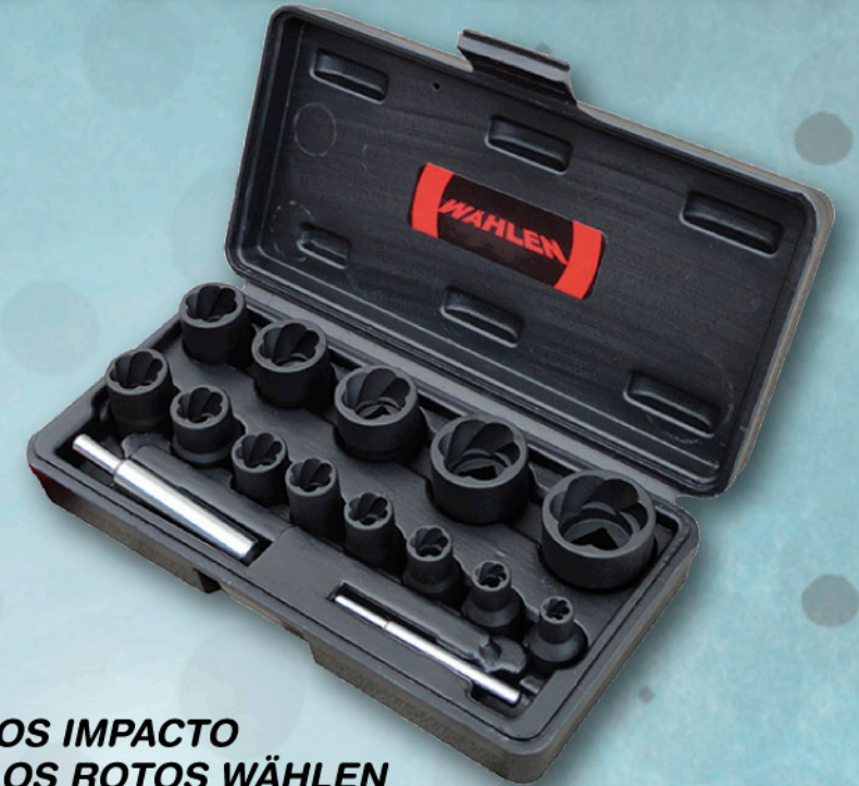
012112 SET VASOS IMPACTO TORINLLOS ROTOS WÄHLEN