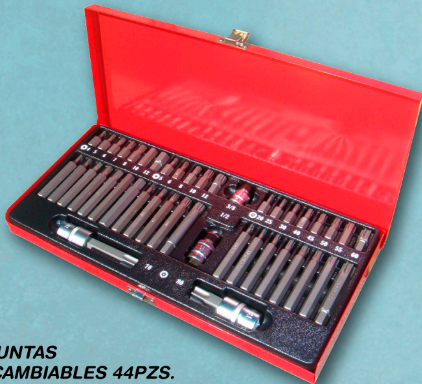
012712 JGO. PUNTAS INTERCAMBIABLES 44PZS.