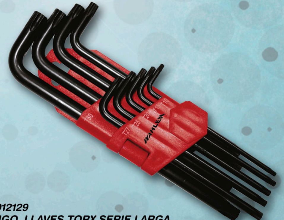
012129 JGO. LLAVES TORX SERIE LARGA