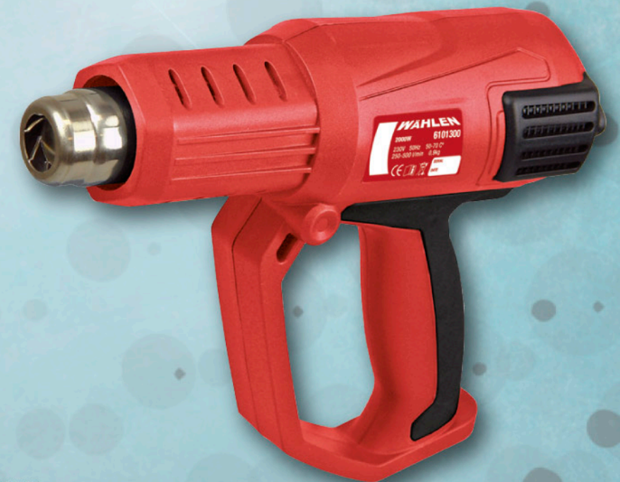
6101300 DECAPADOR TÉRMICO WÄHLEN ADVANCE