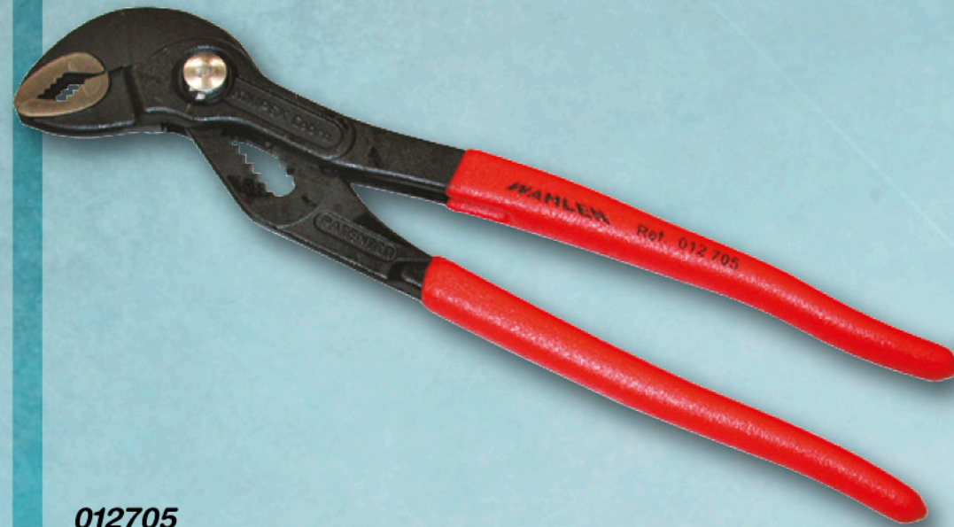
012705 ALICATE PICO LORO AUTOMÁTICO